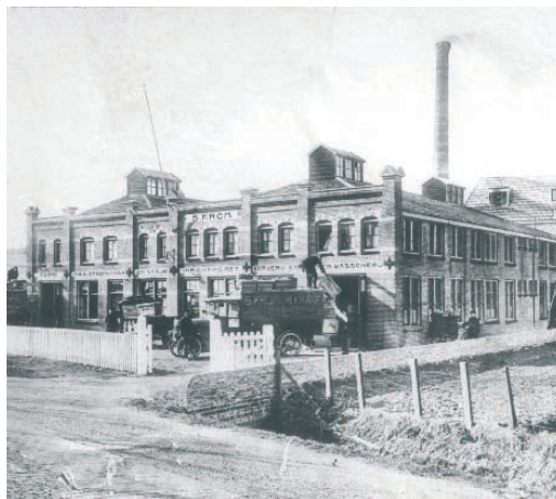
Noord-Hollandsche Stoomwasch- en strijkinrichting S. Krom 1920