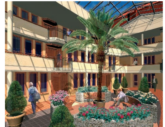
Appartementen 'De Tuinen van Bergen'