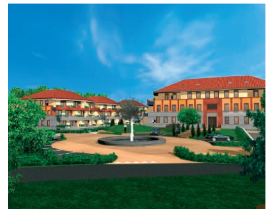
Appartementen 'De Tuinen van Bergen'