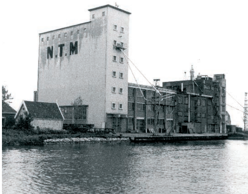
Meelfabriek 1960